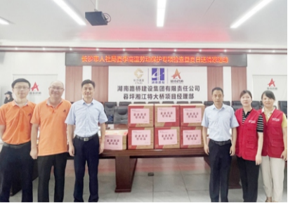
长沙市人社局赴麓坪湘江特大桥项目送清凉。