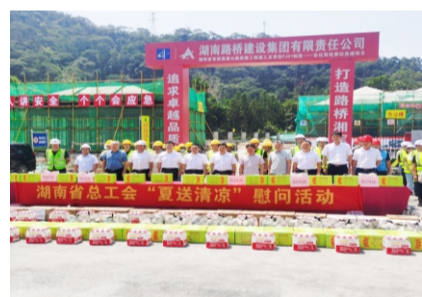
湖南省总工会副主席刘再衡慰问官新房屋建项目一线员工。