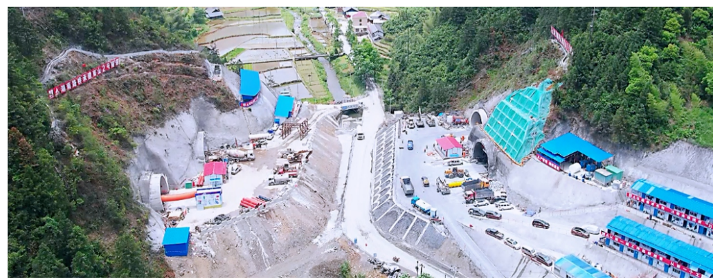
宿溪中桥已完成桩基并回填，南山1、2号隧道正施工