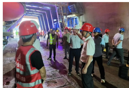
项目承办城龙高速隧道施工交流会

第一次进山时就遇到了瓢泼大雨，在山里淋了个透湿。但那时他主动申请要来项目施展拳脚，面对这份特殊的“见面礼”，他反而觉得自己“来对了地方”。